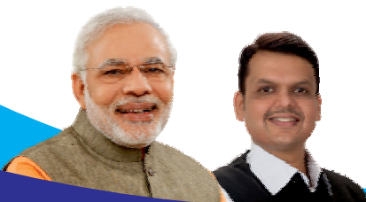
श्री. नरेंद्र मोदी मा. प्रधानमंत्री